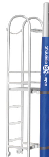
Photo: équipe LNA 2023/24